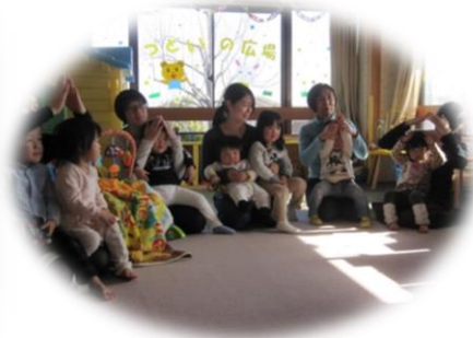
(頭の上で、お山をつくって)